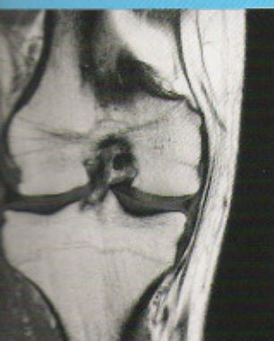
2 Coronale T1-opname

Antwoord op deze vragen vindt u op pagina 27