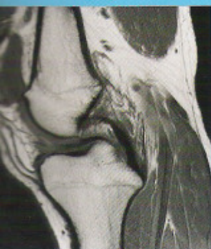
1 Mid-sagittale T1-opname